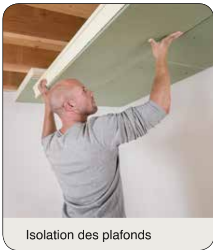
Isolation des plafonds