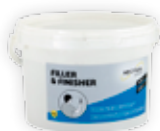
Filler & Finisher