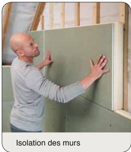
Isolation des murs