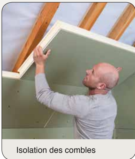
Isolation des combles