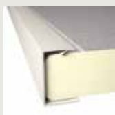
Profisol U wit