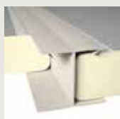
Profisol H wit