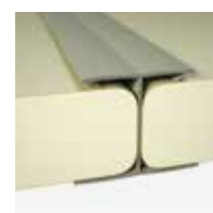
Profisol H profiel