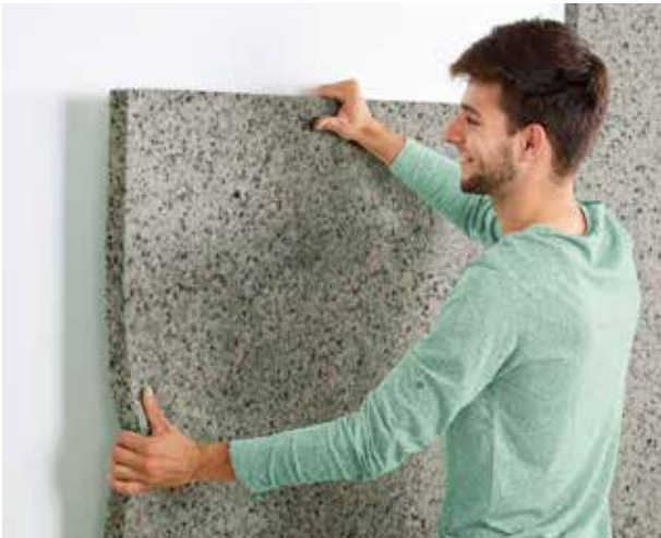
Positionering van de panelen alvorens ze te verlijmen.