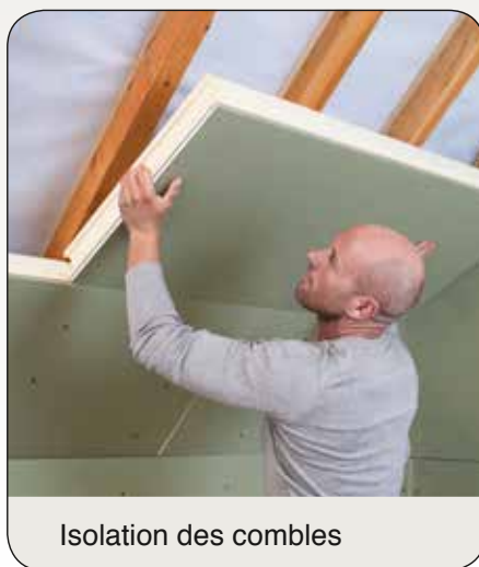
Isolation des combles