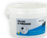
Filler & Finisher