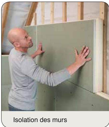
Isolation des murs